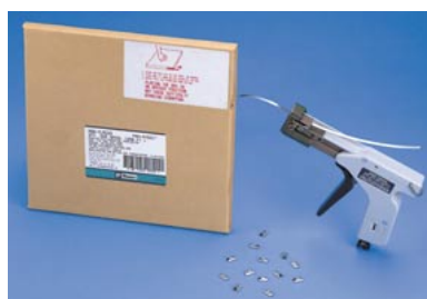
材質：AISI 304、AISI 316